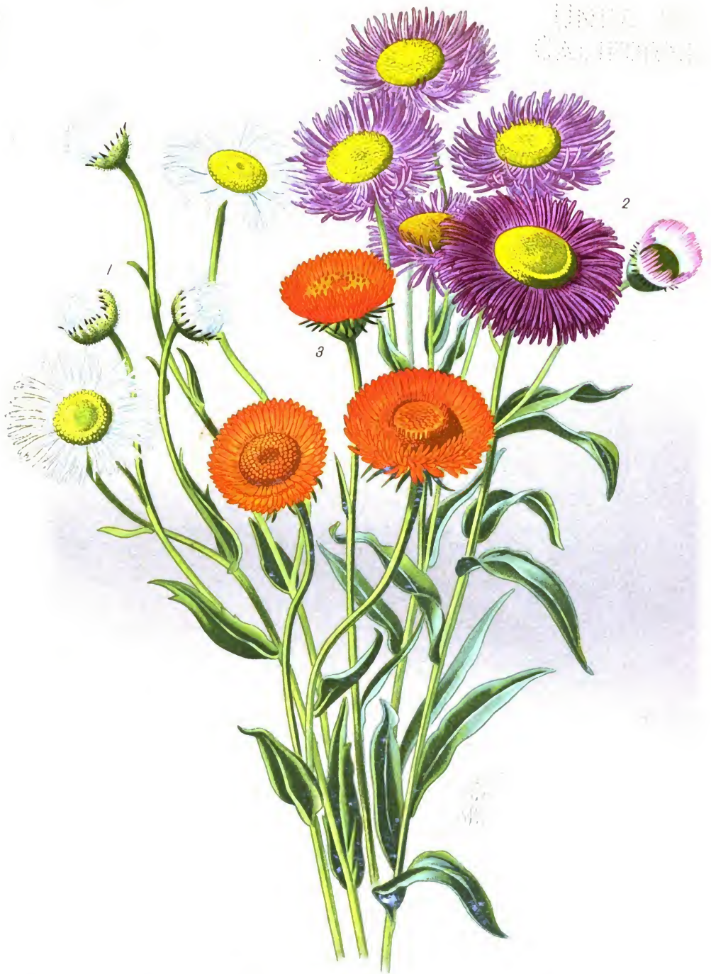
Erigeron Coulteri (1.); E. speciosus var. superbus (2.) et E. aurantiacus (3.).

Загадка Култера [1.]; Загадка прекрасная [2.] и Загадка оранжевая [3.]